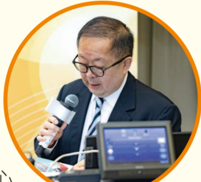
主禮嘉賓李國棟醫生

第三十屆老年學週年會議順利於2023年11月18日，假香港理工大學舉行。是屆會議的主禮嘉賓是安老事務委員會主席李國棟醫生，主題為「Smart Living Smart Ageing」。我們很榮幸邀請到香港大學社會工作及社會行政學系林一星教授和香港理工大學生物醫學工程學系鄭永平教授分別為「人本中心的長期照護」和「樂齡科技」兩大題目作分享。