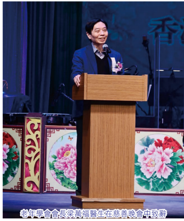
老年學會會長梁智鴻醫生在慈善晚會中致辭

老年學會的「優質安老服務專款」專為鼓勵香港安老院舍提升其服務質素而設，鼓勵更多業界院舍參與評審計劃。當安老院舍在評審計劃中得到認證，他們的服務質素便可以此為保證，既令家人在為長者物色院舍時能以此為指標，更方便快捷地覓得合適的安老院舍，亦令居住在院舍的長者可以有更舒適和安心的生活，安享晚年。