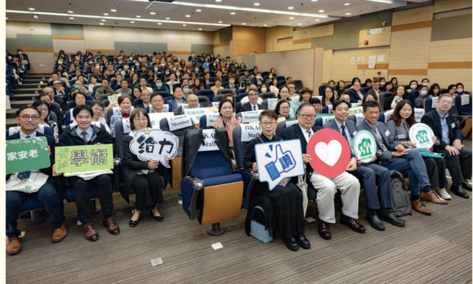
本屆會議有超過350位參加者到場參與老年學相關的學術交流