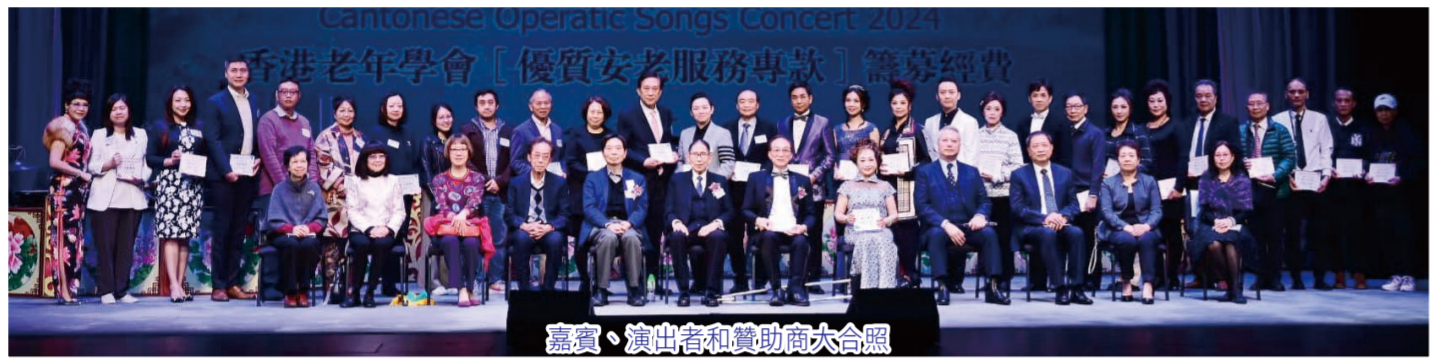
嘉賓、演出者和贊助商大合照