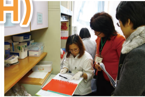
評審團隊在認真聆聽安老院舍員工講述他們平時派藥給長者的流程

惟本會多年來與不同類型院舍接觸和溝通，瞭解到不同規模的院舍在考評上有不同需要，亦得悉社會福利署調整了買位要求政策；為進一步鼓勵不同類型的安老院舍均可持續提升服務質素，香港老年學會除繼續推行「香港安老院舍評審」(RACAS)外，現特別推出第二個院舍評審機制：「安老院舍服務考核」(SAEH)。新機制有25項準則，16項為界定符合社會福利署的「十六項服務質素標準」(SQS 1-16)規定管理要求；9項為院舍保健、衛生管理、保健紀錄、院舍人手及重點保健照顧服務等準則。「安老院舍服務考核」(SAEH)已獲社署認可，通過的院舍將具備政府買位資格。